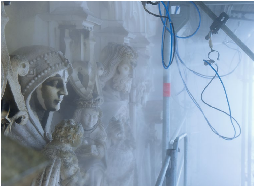
1. La Circoncision. Claveau après nettoyage.